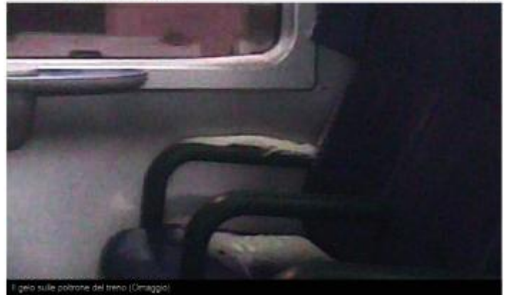
Il gelo sulle poltrone del treno (Ormaggio)

L'impianto di riscaldamento era fuori uso. Gli scompartimenti "surgeati" sono stati chiusi al pubblico ed i passeggeri, oltre a rimanere al freddo, hanno viaggiato ancora una volta stipati come sardine in uno dei convogli