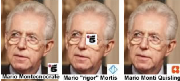
Mario Montecroate Mario "rigor" Mortis Mario Monti Quisling