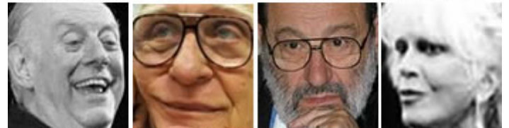
Dario Fo Marco Pannella Umberto Eco Franca Rame