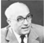
Amintore Fanfani (giugno 1954 - marzo 1959)