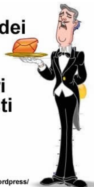
Immagine dei Capi di Governo e dei ministri italiani, visti dalla Ue e dagli Usa.