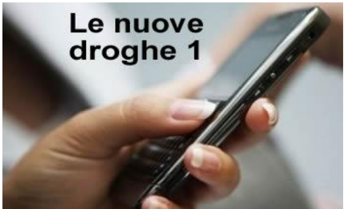
Le nuove droghe 1