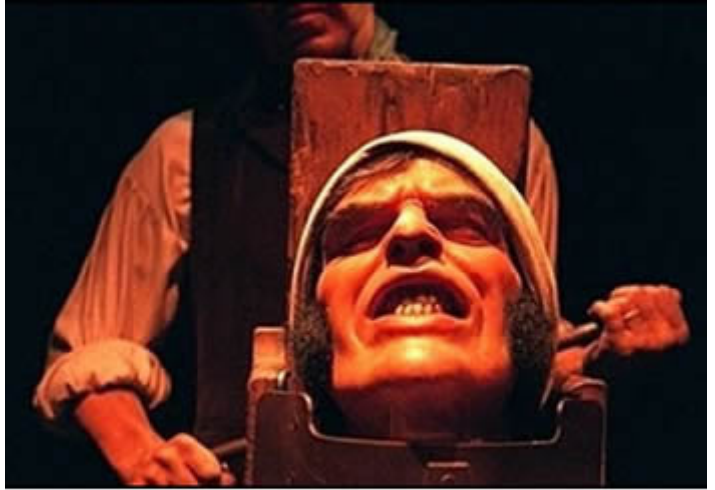
Nuovo sistema per il recupero dell'evasione fiscale