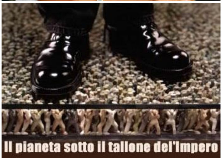
Il pianeta sotto il tallone dell'impero