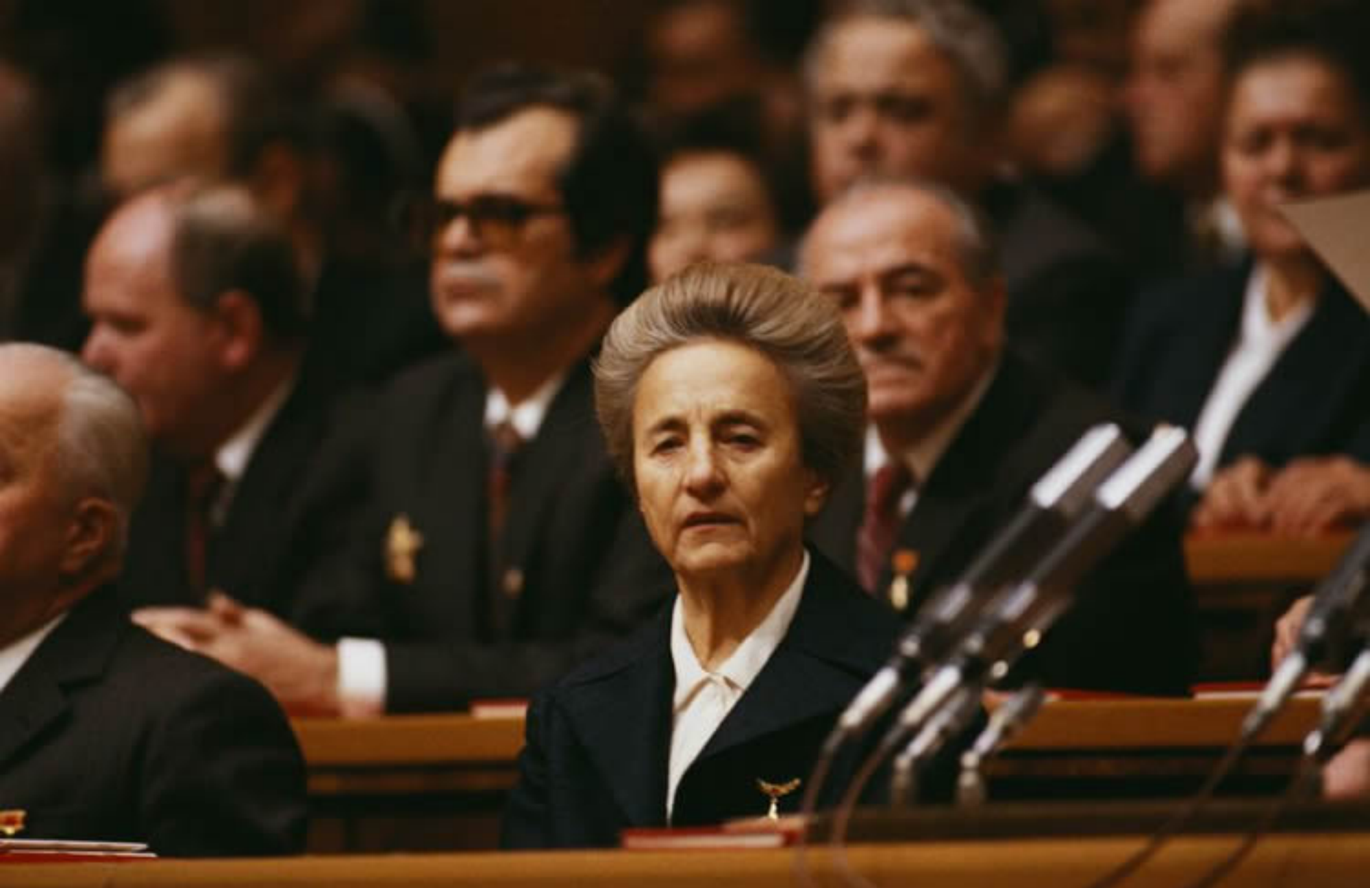
Elena Petrescu Ceaulescu

Vice-Primo ministro della Repubblica Socialista di Romania dal 1980 al 1989